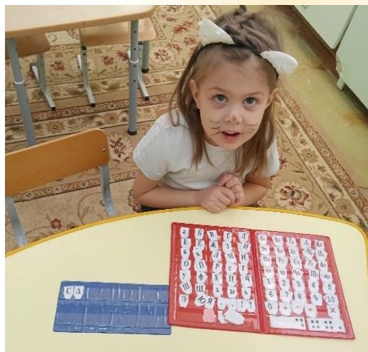
Работа с кассой букв