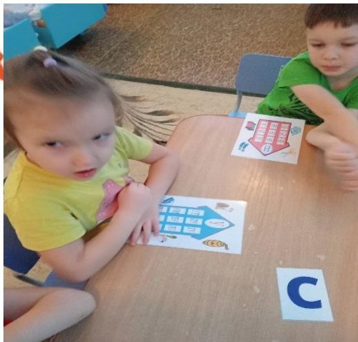
Чтение по слоговым домикам