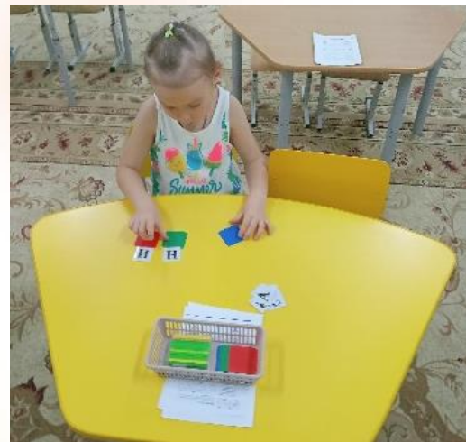
Выкладывание цветовых схем